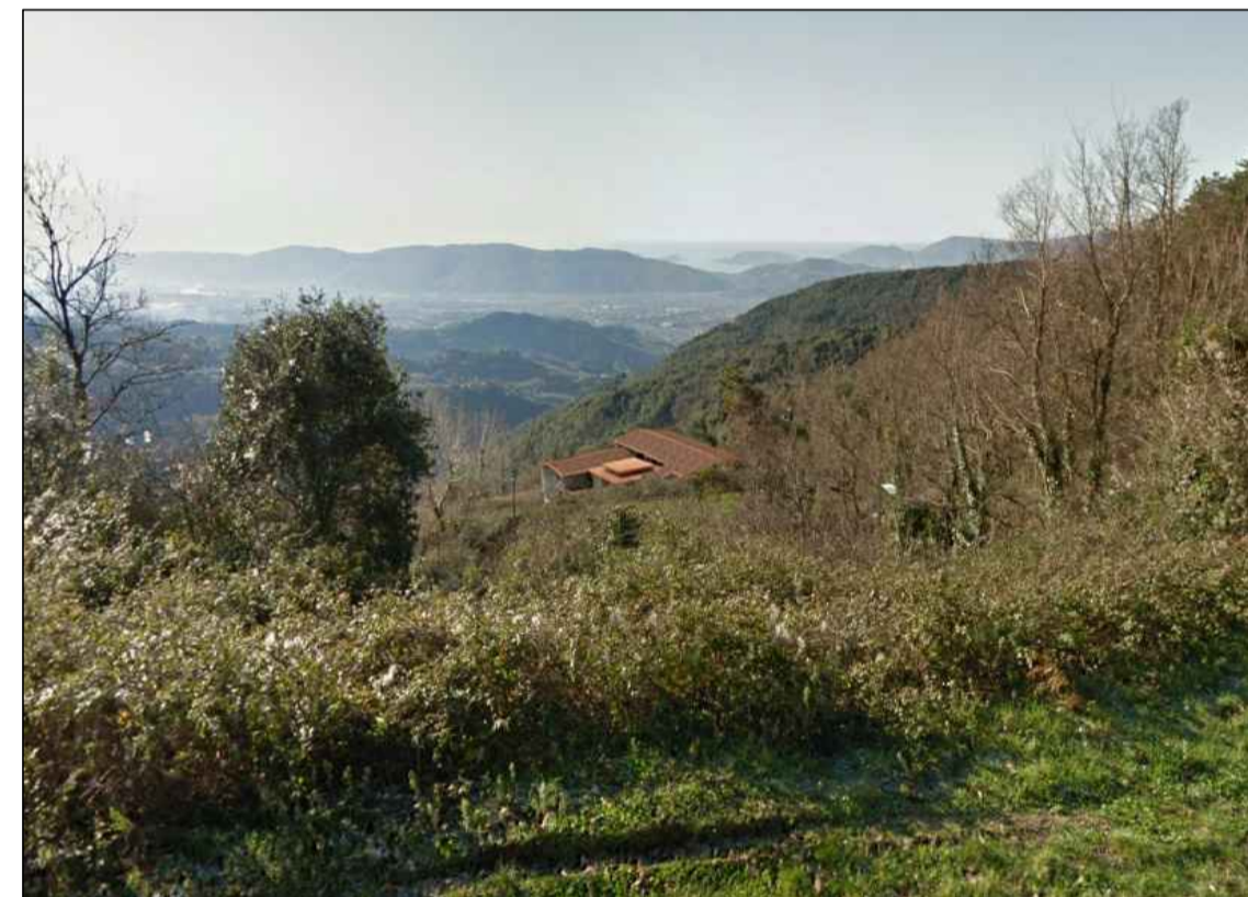
VISTA C' - DALLA STRADA PROVINCIALE