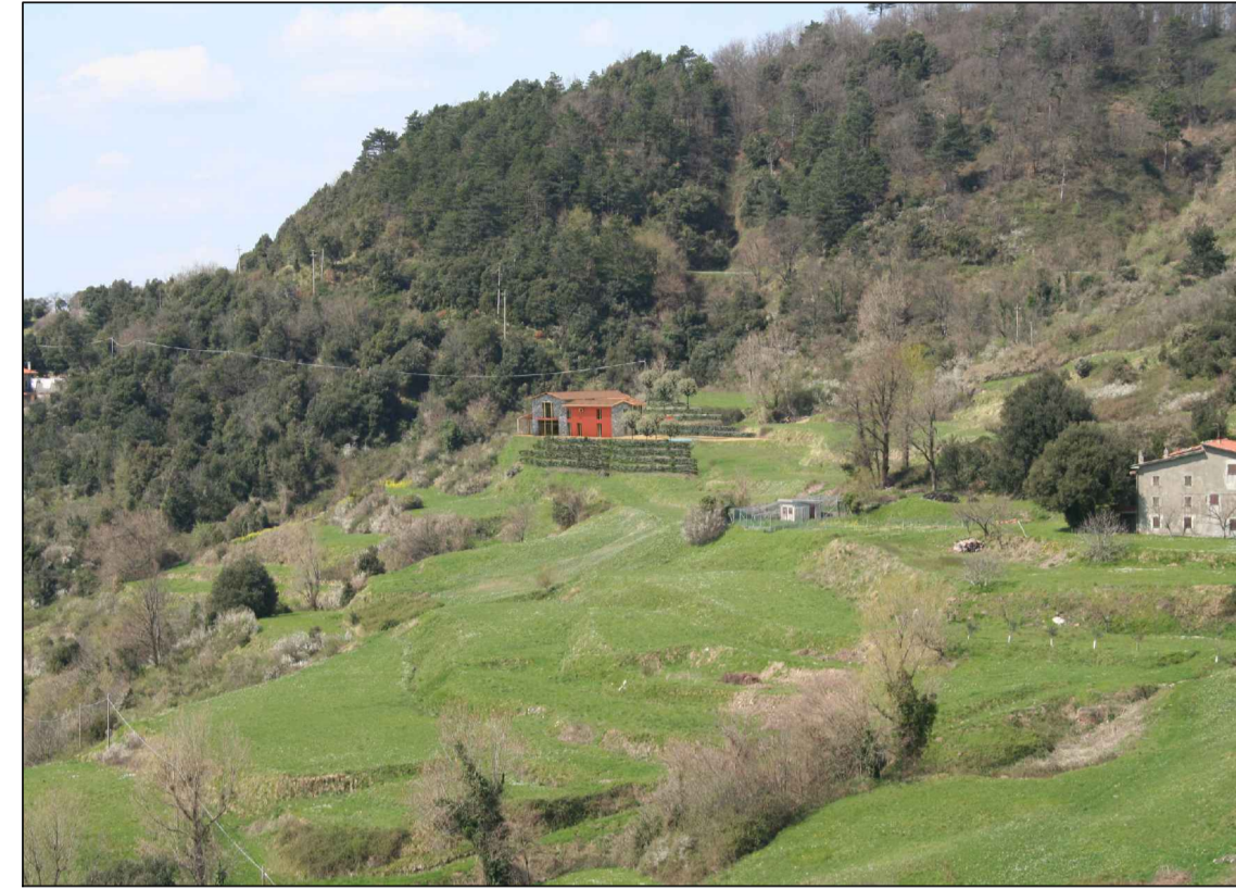
VISTA A' - DA VALLE