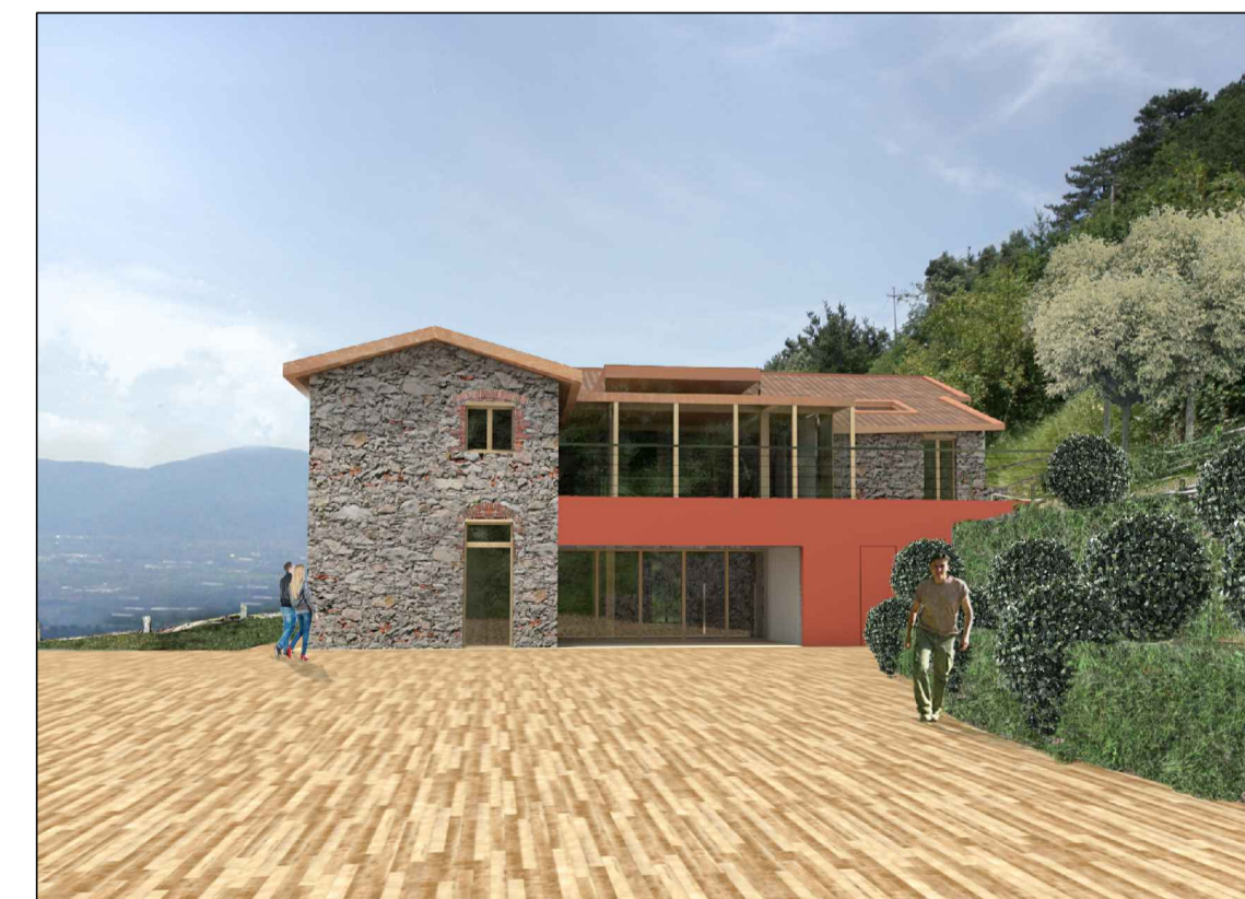
VISTA PROSPETTO EST