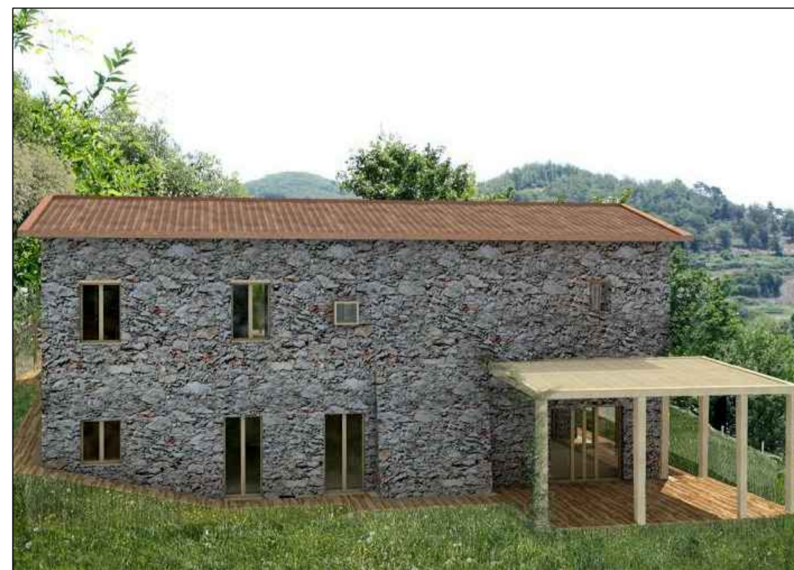
VISTA PROSPETTO OVEST