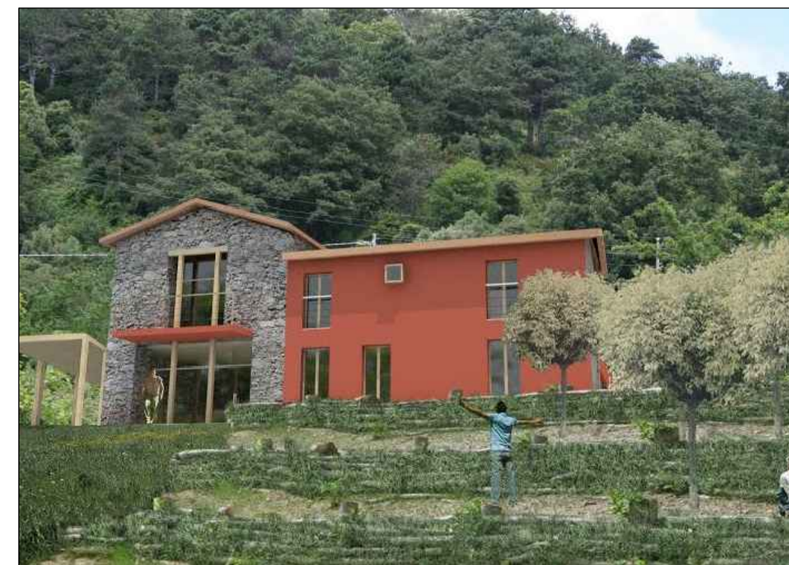
VISTA PROSPETTO SUD