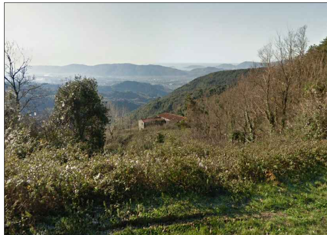
VISTA C - DALLA STRADA PROVINCIALE