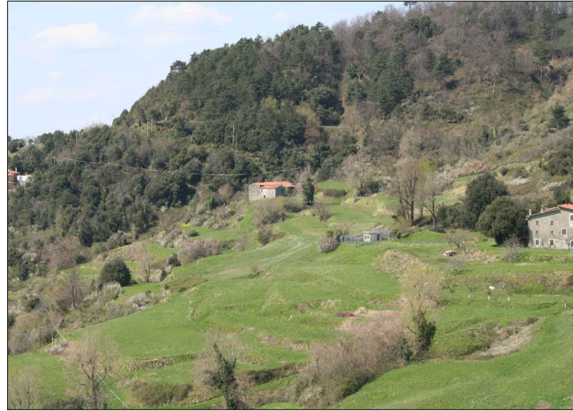
VISTA A - DA VALLE

VERIFICA DELL'IMPATTO VISIVO DOPO IL PROGETTO RIFERITO ALLA TAVOLA 02 UNITA' A e C