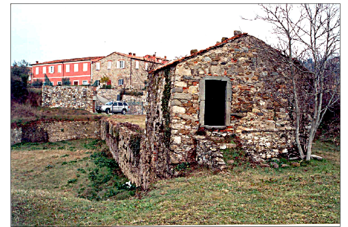
Vista da Sud-Est