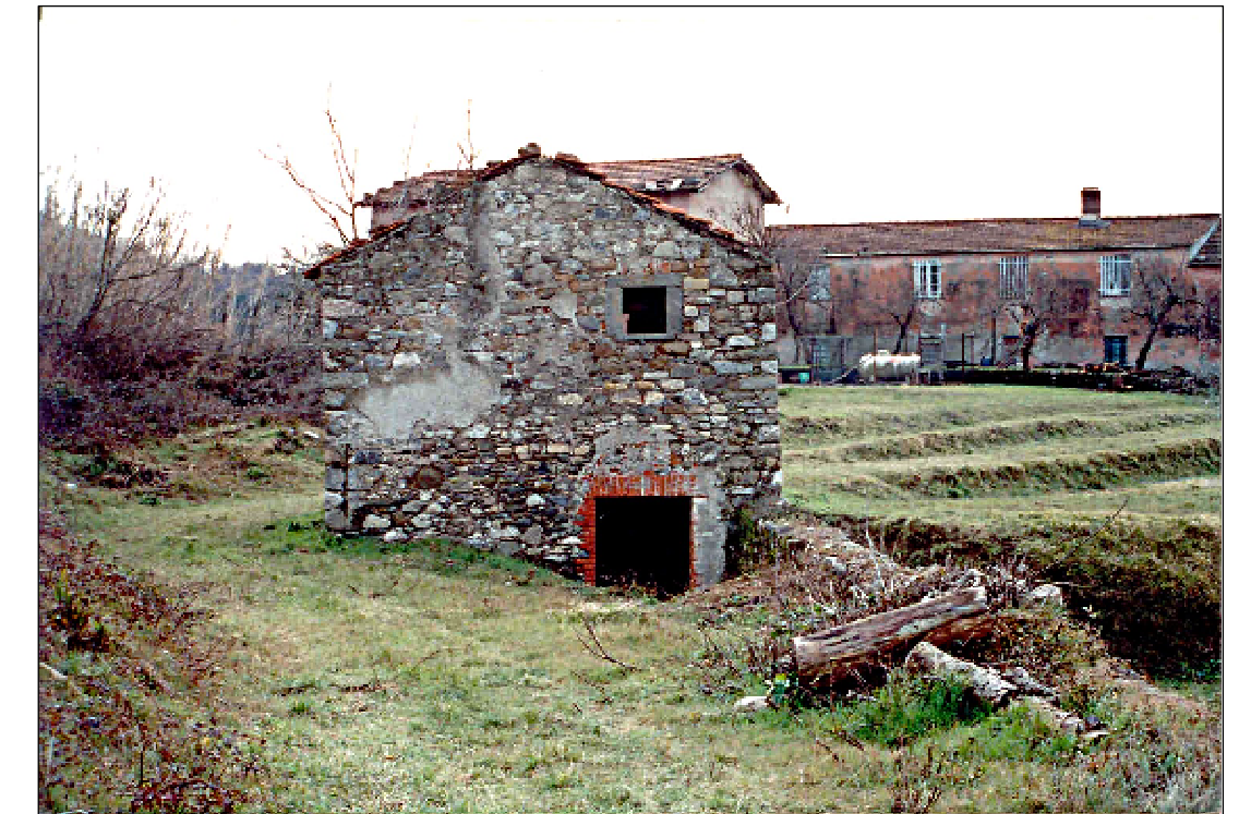
Vista da Nord-Ovest