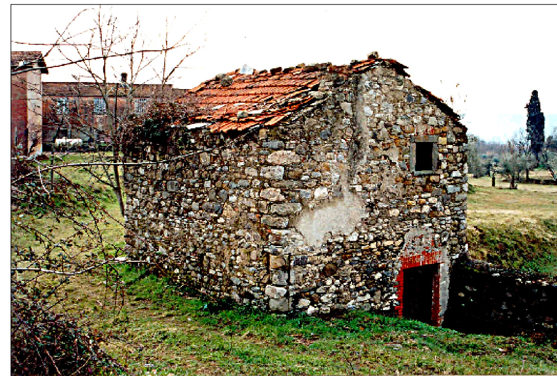
Vista da Nord